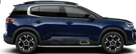
NEW CITROËN C5 AIRCROSS SUV