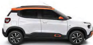
NEW CITROËN C3

Di sekitar kota atau di seluruh negeri, setiap Citroën memiliki DNA desain yang dinamis dan ramah lingkungan yang memberikan kenyamanan murni. DNA inilah yang diterjemahkan dengan sempurna melalui persembahan Citroën berupa hatchback dengan desain unik dan SUV kelas Comfort.