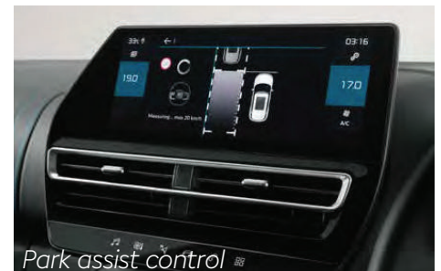
Park assist control