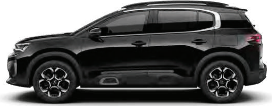
PEARL NERA BLACK