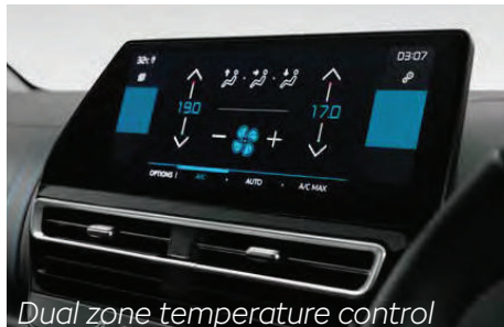
Dual zone temperature control