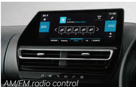
AM/FM radio control

Layar sentuh kapasitif berwarna hitam mengkilap dengan kualitas tinggi berukuran 25,4 cm yang responsif dan intuitif, memungkinkan akses mudah untuk menikmati fitur smartphone Anda dan tetap terhubung dengannya di jalan. Layar pintar ini juga menawarkan kontrol untuk sistem Dual Zone Temperature, input Kamera Belakang dan Peringatan Istirahat yang unik. Selain itu, ia mengontrol fitur Park Assist yang unik untuk parkir Paralel dan Tegak Lurus dengan kontrol Kemudi Otomatis.